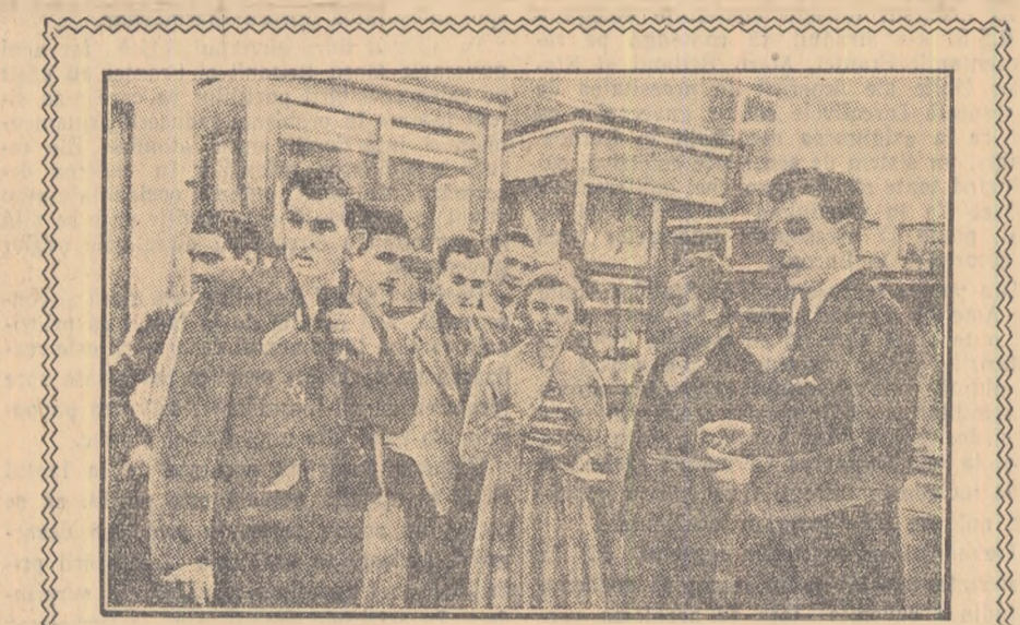
În fotografie: un grup de studenți scoțieni discutînd cu studenții și asistenții vizitatori într-un laborator al Universității „Lomonosov” din Moscova, cu prilejul vizitei lor în U.R.S.S.