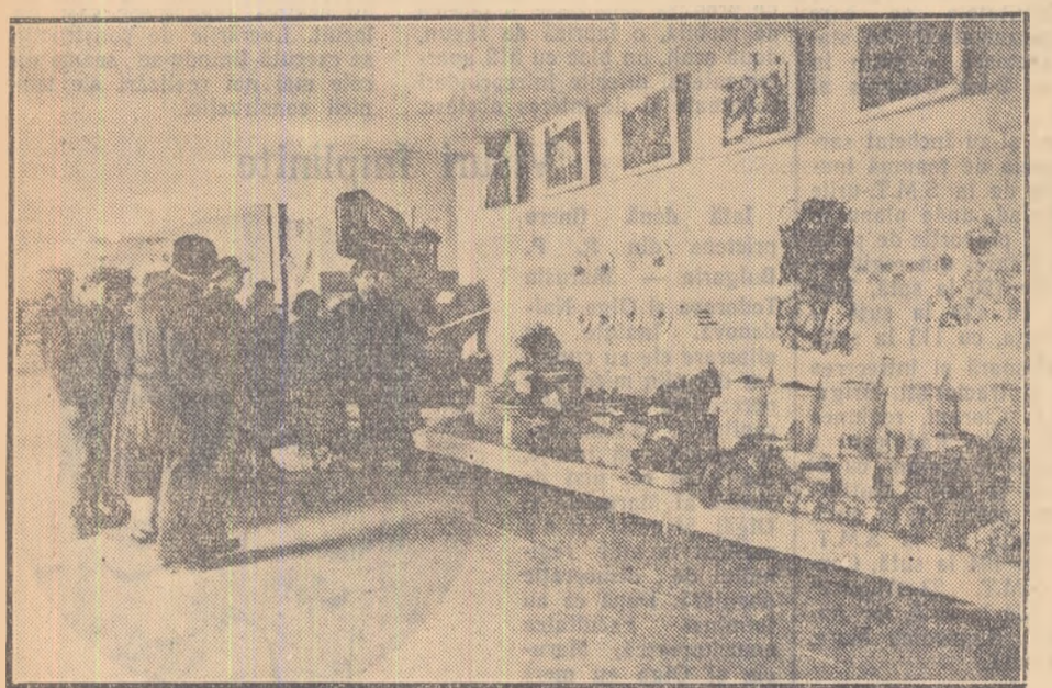
Un aspect de la expoziție