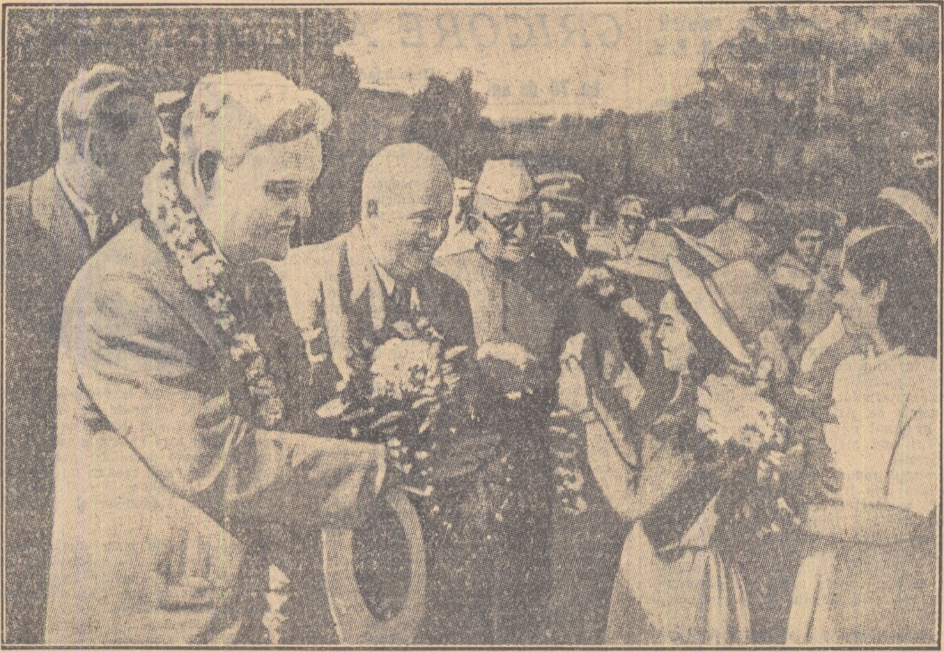
Vizita lui N. A. Bulganin și N. S. Hrușciov în India. În fotografie: Agra. Copiii oferă flori lui N. A. Bulganin și N. S. Hrușciov.