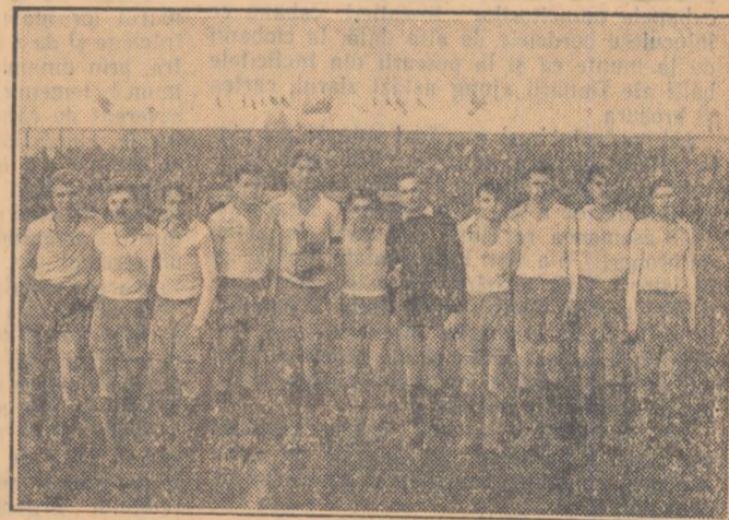
Echipa de juniori a asociației Știința Cluj, campioană republicană de fotbal pe anul 1955.