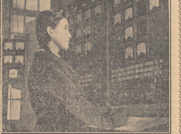
In zilele acestea pe șantierele noilor centrale electrice ale planului de electrificare se fac ultimele lucrări pentru punerea lor în funcțiune.

Grupa studentescă — colectivul în care studenții își desfășoară activitatea în anii de facultate — are o mare influență asupra caracterului, deprinderilor și convingerilor fiecărui student.