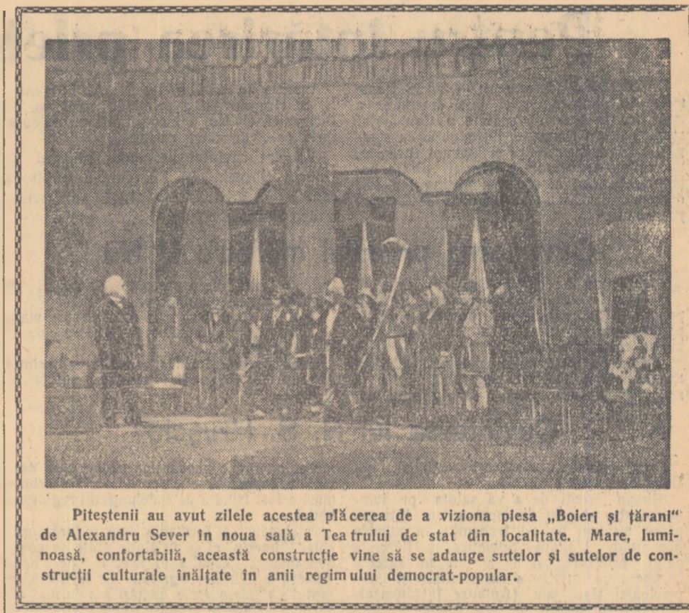
Piteștenii au avut zilele acestea plăcerea de a viziona piesa „Boieri și țărani” de Alexandru Sever în noua sală a Teatrului de stat din localitate. Mare, luminoasă, confortabilă, această construcție vine să se adauge seturilor și sutiilor de construcții culturale înalte în anul regimului democrat-popular.