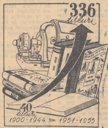
Graficul acesta reprezintă media anuală a aparițiilor de cărți tehnice.

Astăzi în saloanele muncitorului alături de unelte de lucru se află deseori cîte o carte tehnică, după cum în casele multor țărani muncitori gă-