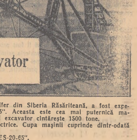
Un uriaș excavator

● Colectivul de muncitori de la uzina de rulmenți „L. M. Kaganovici” din Moscova și-a îndeplinit înaintea de termen sarcinile ce-i reveneau în cadrul celui de al cincilea plan cincinal. Numai în primele 9 luni din acest an, colectivul a economisit 1495 tone metal și peste 7 milioane kilowați-ore energie electrică.