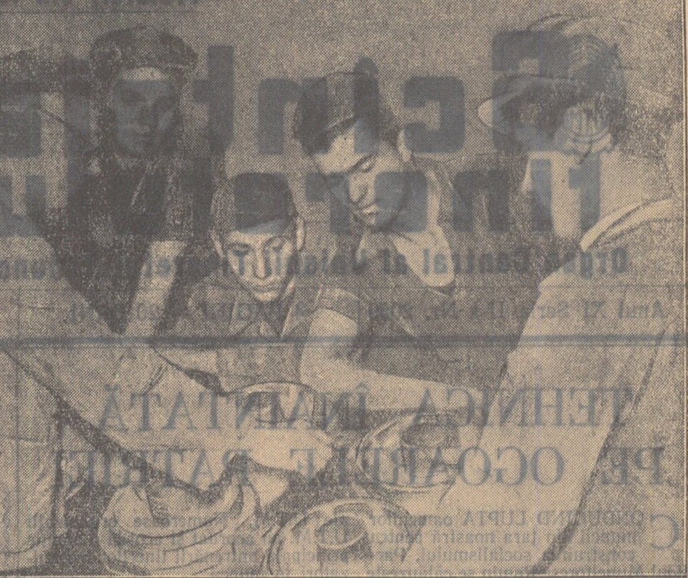
Pentru 3.000 vagoane de cărbune peste plan

Așa se și vede. Că poporul nostru are în sfîrșit, conducătorul dorit, așa cum îl descrie poetul Alexandru Vlașcu pe care cu umplînia îl parafrazez: „Valurile de-numeric despîcîndu-le în două, / Splendida-naintea noastră ne arată o lume nouă“.