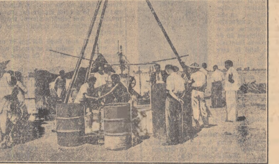
Specialiștii sovietici și indieni supraveghind lucrările de foraj în vederea construcției unei mari uzine metalurgice din India

Fiecare regiune va confecționa și va accorda comisiei raionale de organizare care a realizat cea mai mare mobilizare, cite o cupă. Comisiile raionale vor accorda cite o plăchetă comunei sau localității care a realizat cea mai mare mobilizare. Comisiile regionale, raionale și orașenești vor accorda de asemenea premii în echipament și material sportiv în raport cu posibilitățile locale”