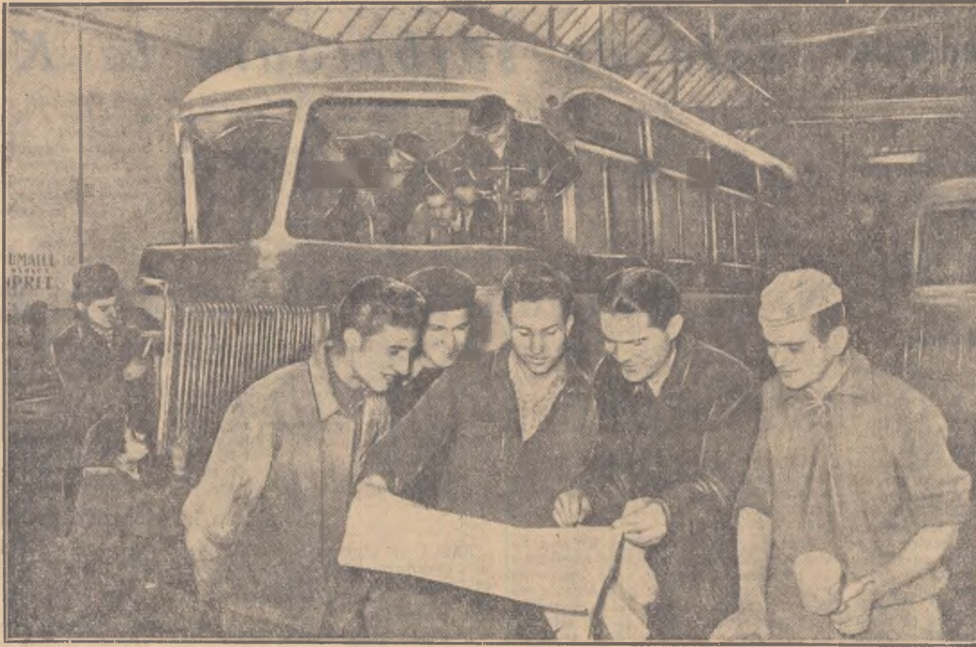
Tinerii constructori de automobile și șeful lor, urmînd noile schițe.