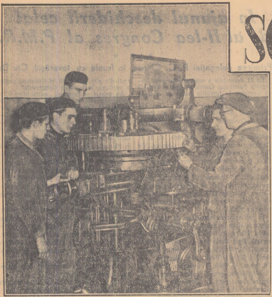
Înainte de a intra în schimb, o parte din brigada de tineret din secția instalații mecanice a Complexului „Grivița Roșie” a observat, împreună cu comunistul Burdula, un „amănunt” neprevăzut în lucrarea unei piese. Dar problema va fi fără îndoială rezolvată repede.

Pagină redactată de ION BAIIEȘU și PETRE ISPAS.