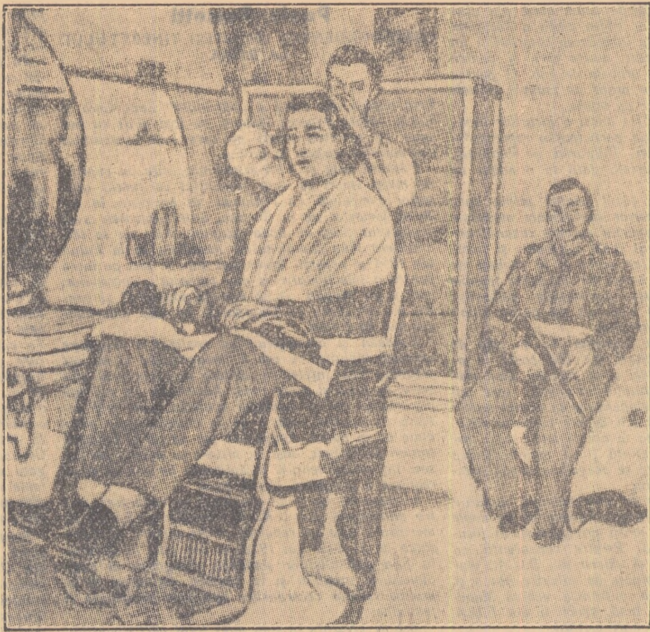
„Scînteia tineretului“ Pag. 4-a 5 ianuarie 1956

Unii își scot haina la frizer alții nu, aceasta depinde de gust dar să te tunzi stînd cu mitraliera pe genunchi e nemăslînit. Dar în Cipru așa procedeză soldații englezi — după cum se vede în fotografie — de teamă nu că vor fi ciușiiți cu mașina de tuns, ci de frica întîlnirii cu patrioții ciprioți. Aceștia luptă pentru independența patriei lor înfrîntînd teroarea colonialistă.