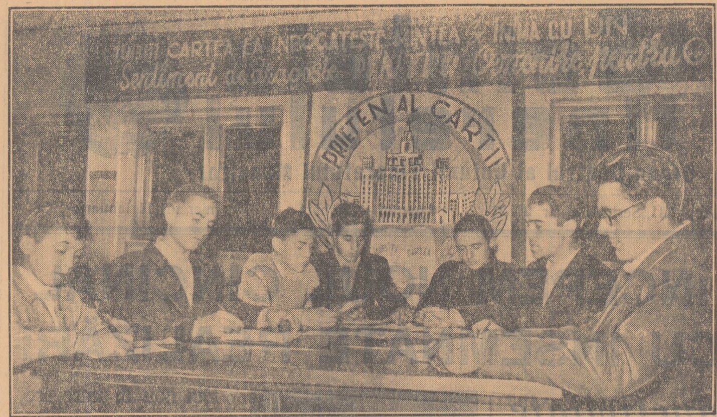
Tinerii constructori ai marilor hidrocentrale de pe Bistrița își petrec timpul liber în mod plăcut și instructiv. In fotografia noastră: un grup de tineri la cercul literar de la Clubul central Bileaz.