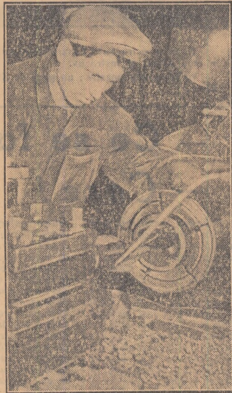
Utilaj pentru șantier

Colectivul uzinei „Progresul” din Brăila a studiat cu multă atenție, în lumina Direc- tivelor Congresului partidului cu privire la cel de al doilea plan cincinal, posibilitatea perfecționării tipurilor de utilaje produse în prezent, precum și trecerea la fabricația în serie a unor noi tipuri de utilaje pentru construcții.