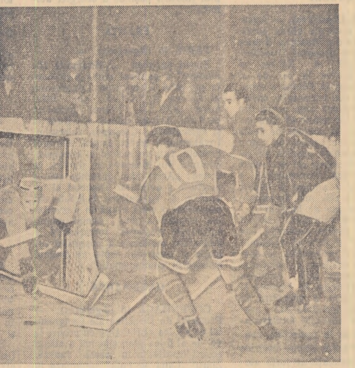
De cîteva zile, la Orașul Stalin se desfășoară întîlnirile din cadrul turneului final al campionatului R.P.R. de hochei, la care iau parte cele mai bune echipe din țară.