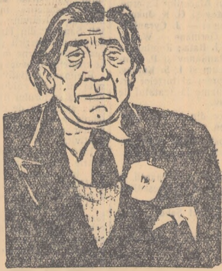
Desen de CIK DAMADIAN

fenia... Nici vorba să apară... Păi cum să nu cazi în brațele formalismului? Mi-au răs- puns la poșta redacției... Arată spre părul său alb ca eu să ghicesc