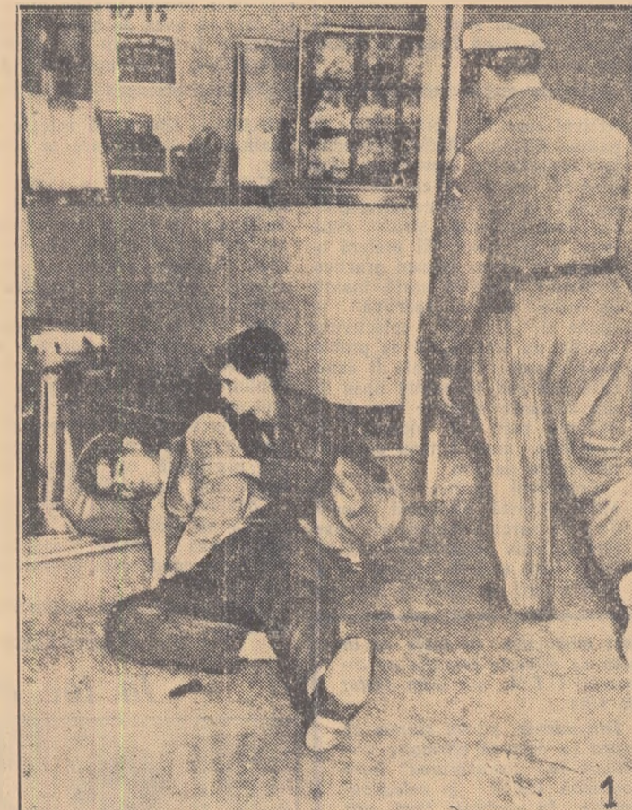
Cuba este numită „zaharnița lumii”. Mii de tone de zahăr pleacă din porturile Cubei în lumea întreagă. Dar viața oamenilor simpli din țara care ar trebui să fie „cea mai dulce din lume, este din cale afară de amară. Priviți fotografiile alăturare. La redacția noastră au sosit mai multe. Am ales doar aceste trei. Ele nu sînt încă cele mai îngrozitoare.