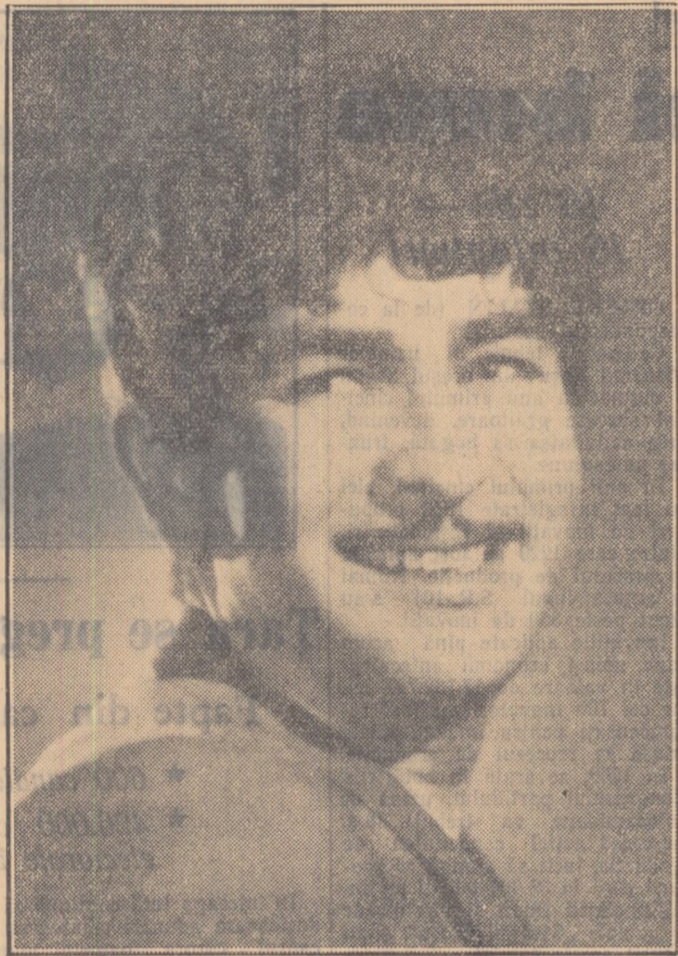
Raj Kapoor, interpretul și regizorul „Vagabondului”