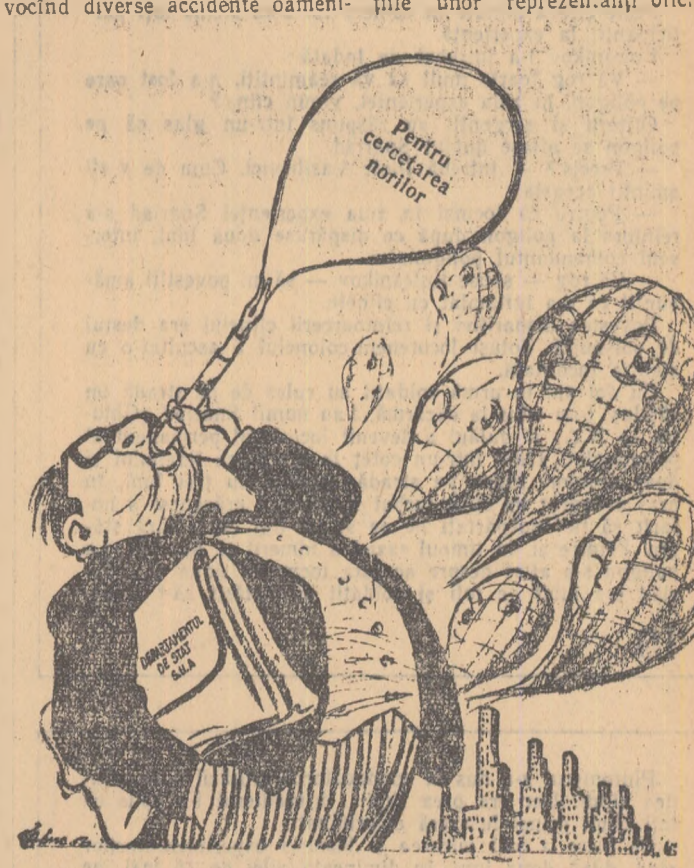
Desen de ADRIAN LUCACI

dignarea altă a oamenilor care trăiesc și muncesc pasnic în Uniunea Sovietică și în țările de democrație populară, cit și a celor care trăiesc în alte țări și văd lucrurile cu luciditate. Afirmările unor reprezentanți oficiali