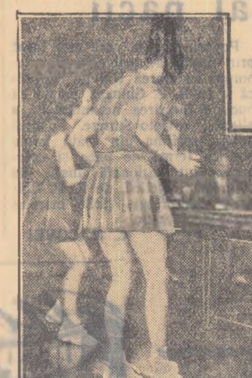
Ella Zeller respinge o minge „tare”. Fază din jocul de dublu dintre Rosalinde, Diana Rowe—Angelica Rozeanu, Ella Zeller, partidă câștigată de jucătoarele noastre cu 2-1 (21-11, 10-21, 21-10).