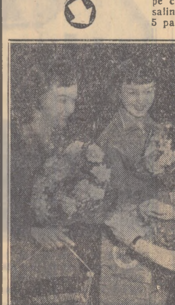
CITIIȚI în pagina 3-a rubrica: