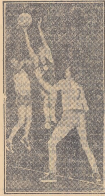
O fază din meciul „Proleter” — „Dinamo”

Antrenorul V. Stankov și arbitrul Svetislav Schapper ne-au vorbit despre pregătirea tinerilor baschetbaliști iugoslavi din Zrenianing. Clubul „Proleter” se îngrășește și de echipa sa de juniori și de pionieri (copii de 12-15 ani) care sînt selecționați dintre cei mai talentați jucători din campionatul școlar. Le desăptăminte baschetbaliștii iugoslavi și-au manifestat bucuria pentru ospitalitatea cu care au fost primii și înconjuși în țara noastră.