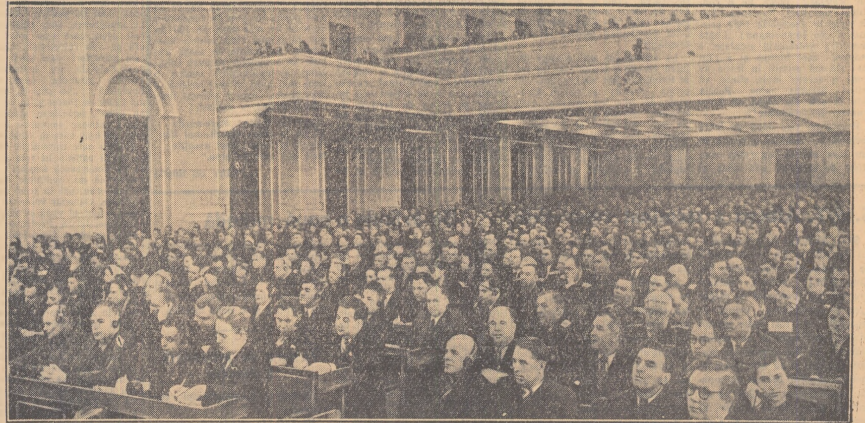
Aspect din sala de ședințe a Congresului al XX-lea al P.C.U.S.