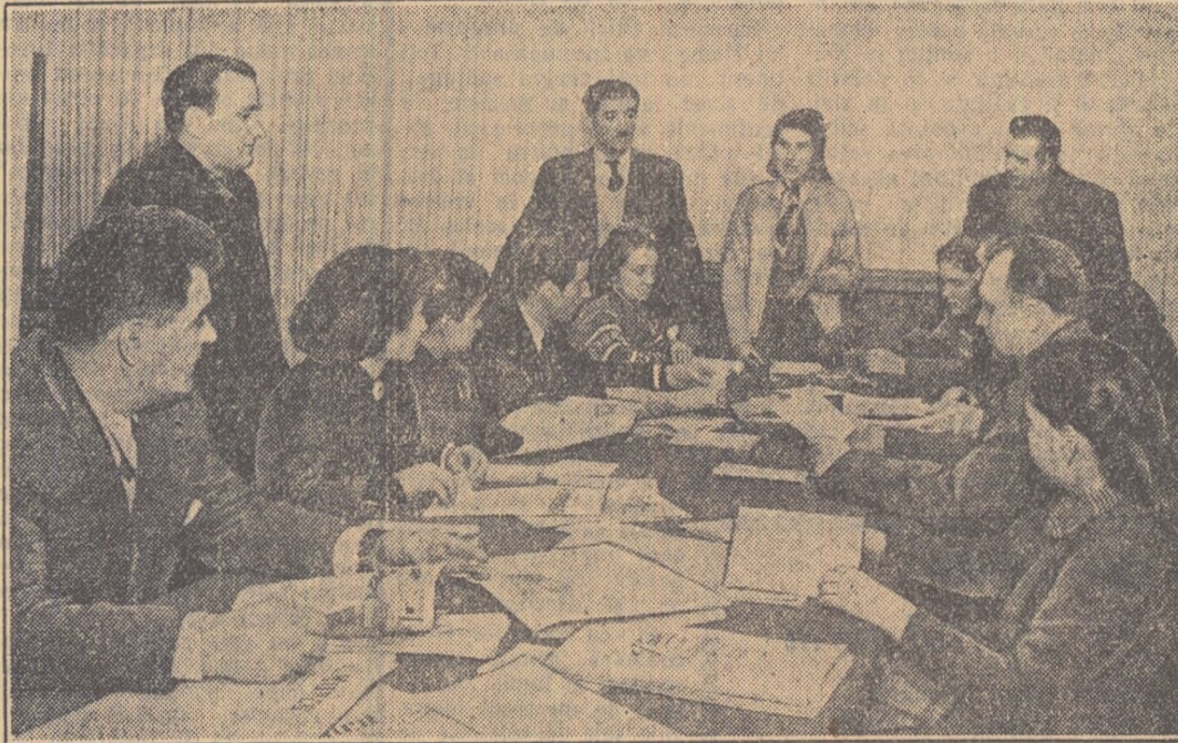
În Casa de cultură a sindicatelor din B-dul 6 Martie, funcționarii Casa Alegătorului pe Capitală.