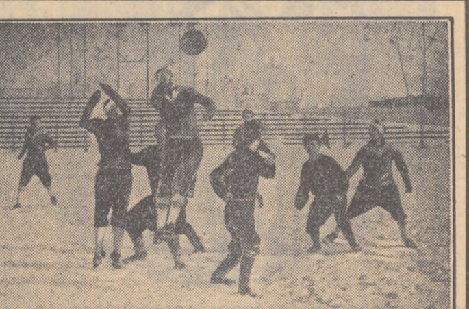
Citiți în pagina a doua a ziarului nostru rubrica SPORT

de a-mi croi un drum în viață m-am înscris la Școala medie tehnică de cărbune din Cîmpulung.