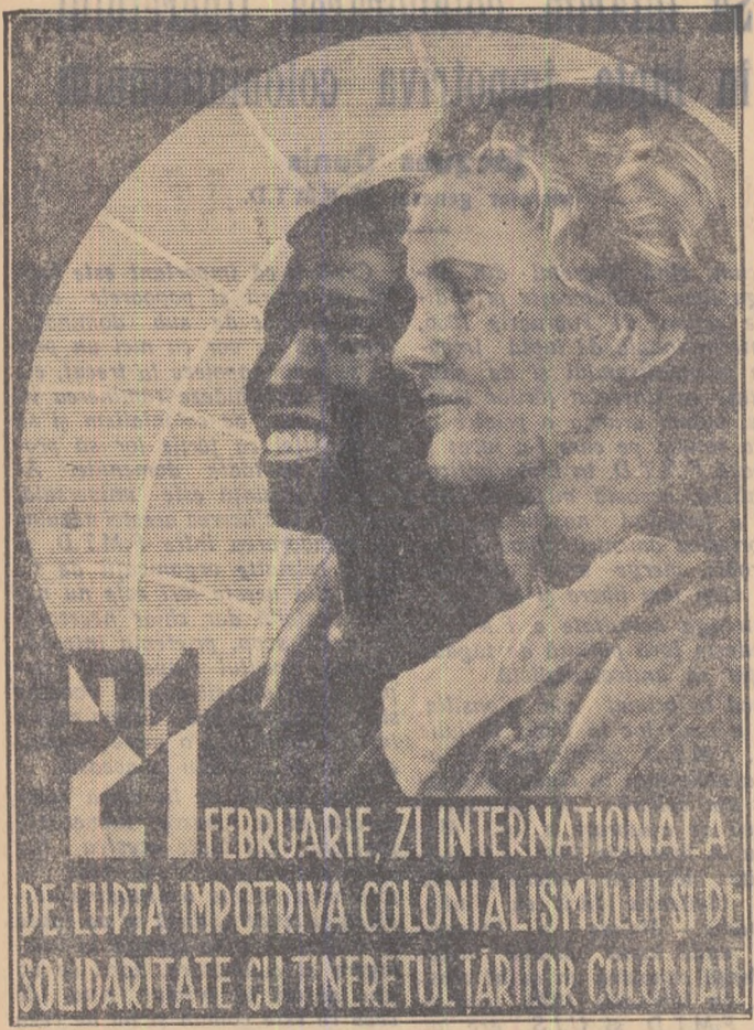
FEBRUARIE, ZI INTERNAȚIONALĂ DE LUPĂ ÎMPOTRIVA COLONIALISMULUI ȘI DE SOLIDARITATE CU TINERETUL ȚĂRILOR COLONIALE