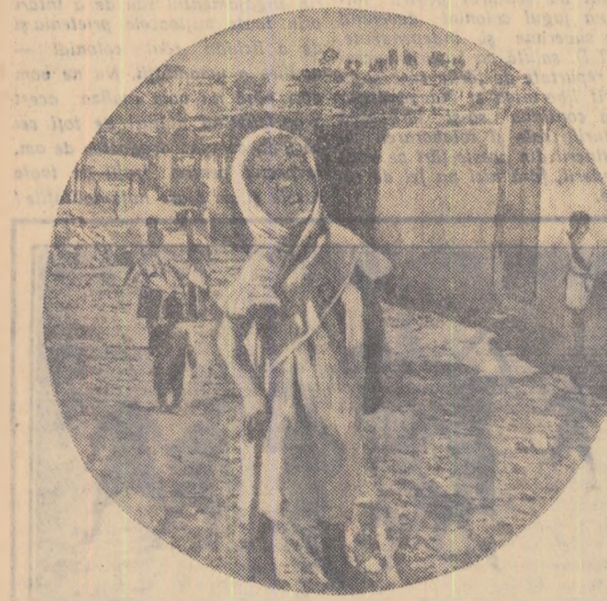
În această fotografie publicată de presa franceză arată din plin ce înseamnă regimul colonialist: lăta cocioabele în care locuiesc mii și mii de oameni în Tunisia. În copilul din primul plan al fotografiei este o dovadă elocventă a ceea ce înseamnă viața de chin în multe țări asuprite.

ALGERIA: Aproximativ 400.000 de copii merg la școală în țara cu populație de 7.230.000. În 1954 mai mult de 2.000.000 de copii de vîrstă școlară n-au fost primii la școală. Din 5.000 de studenți care în vînzărie au fost trimiși la universitatea din Alger, doar 500 sînt musulmani, cu toate că populația musulmană formează 90 la sută din locuitorii țării. AFRICA OCCIDENTALĂ FRANCEZĂ: Din 2.690.000 copii de vîrstă școlară doar 100.000 merg la școală, adică 3,7%. În ritmul actual al construcției de școli ar trebui 175 de ani pentru a construi clădirile necesare. NIGERIA: Proporția copiilor care merg la școală în raport cu numărul total al copiilor nescolarizați este de 2,26%. (Cifrele de mai sus au fost extrase din Buletinul Direcției „Învățămînt și tineret” al unui Minister francez). KENYA: Pentru un copil negru care frecventează școala alocațiile bugetare sînt de 200 de ori mai mici ca cele destinate unui copil al unui colonist european.