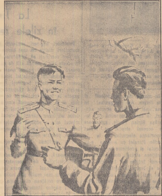
Ostașul eșu în tranșea și nu se mai ridică. Fusesse rănit grav la piciorul stîng. Mai scrie în gazeta că ostașul sovietic „se află împreună cu voluntarii romîni în același spital de front”. Asta era țiu și eu nu știusem nimic pînă atunci...