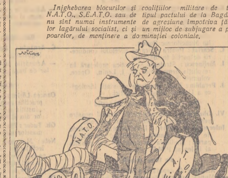
Cortegiul noului colonialism desen de NICOLAESCU NIC.