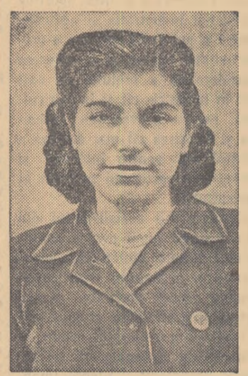
Utemiștii — inițiatorii unor acțiuni interesante

La „Casa Alegetorului” s-au dat pînă acum și 2 spectacole prezentate de către echipa artistică a cîminului cultural. Membrii comitetului organizației de bază U.T.M. din comuna Rîzești, raionul Murgeni, au reușit ca în această perioadă să atragă în acțiunile întreprinse aproape tot tineretul comunel. Ei au ținut o adunare de U.T.M. deschisă în cadrul căreia a fost prezentat un referat cu tema „Alegeriile din trecut și de azi”. În adunare s-au stabilit măsuri concrete pentru sprijinirea desfășurării în bune condiții a alegerilor de deputați în sfaturile populare.