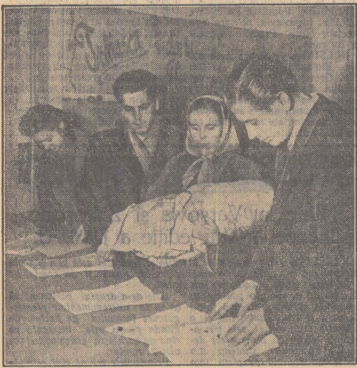
La centrul nr. 2 de verificare a Grădina Roșie, numeroși cetățeni consultă listele.

TINERII VERIFICAȚI DACA VA AFLAȚI TRECUȚI PE LISTELE DE ALEGAȚORI.