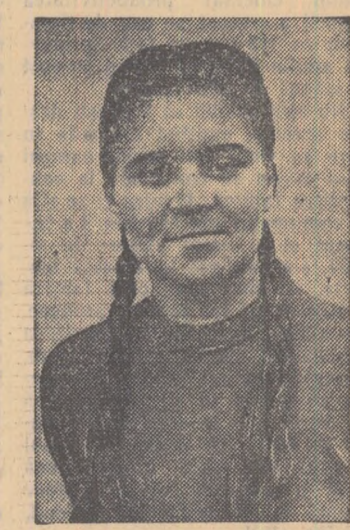
Utemiștii — inițiatorii unor acțiuni interesante

Cu același entuziasm întîmpină alegerele numeroși alți tineri, că-