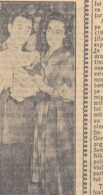
— Un dar, mai ales gustos.

ghicească după textele literare titlul și autorul cărții. Carnavalul organizat de Comitetul Raional U.T.M. și responsabilii culturali, desigur că nelncrat vor folosi experiența bună însușită aici. Așteptăm invitații.