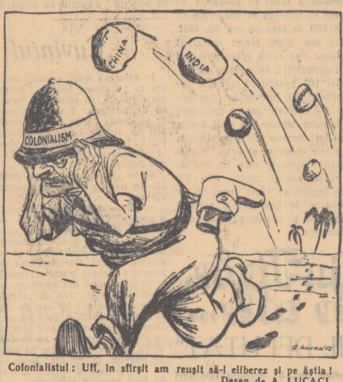
Colonialismul: U.F. în sfârșit am reușit să-l eliberez și pe ăștia! Desen de A. LUCACI

Colonialiștii pretind că grație lor s-au eliberat sute de milioane de oameni din colonii