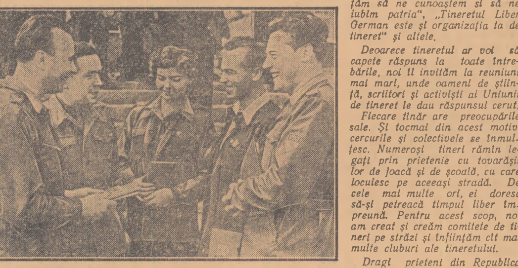
Construcții al R. D. Germane, tineri plini de viață, fericiți — lată se exprimă această fotografie făcută cu ocazia unei întruniri a F.D.J. a Erfurt.