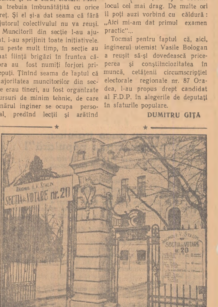
In prezent secțiile de votare din întreaga țară sint amenajate cu febrilitate. In clișeu exteriorul unei secții de votare din raionul L. V. Stalin din București.