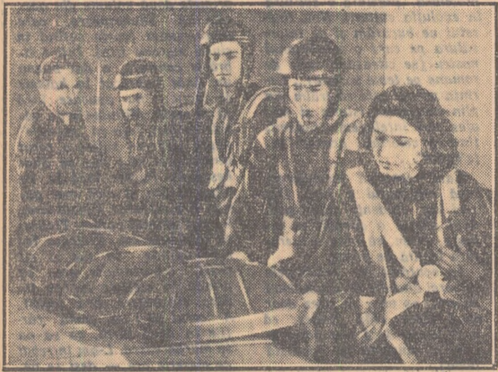
„Sportul celor curajoși” — așa obîșnuiește să fie numit parasutismul — sportul celor care părăsind în aer pasărea de oțel, se ațuina pentru cîteva minute să cucerească văzduhul.

O tînetinică pregătire fizică, respectarea indicațiilor instructorilor, pregătirea de lansare superioară, iată cîteva din bagajele care trebuie să-ți însoțească în drumul său pe un tînet parasutist. Acum, după ce toate acestea au fost puse la punct, parasuțiștii își verifică pentru ultima oară parașutele, se echipează sub privirile atente ale instructorului (fotografia 1).