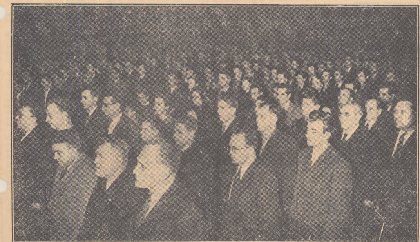
În sala Ateneului, în timpul adunării de doliu.

În tot cursul zilei de vineri mult de oameni ai muncii au continuat să viziteze Ambasada R.P. Polone unde au semnat în registru, exprimîndu-și sentimentele de solidaritate cu poporul polonez care a suferit o grea pierdere prin încetarea din viață a marelui său fiu, tovarășul Boleslaw Bierut. Printre miile de persoane care au semnat în registrul Ambasadei, aducînd un ultim omagiu tovarășului Boleslaw Bierut, sînt muncitori, funcționari, militari, elevi și studenți, activiști ai organizațiilor de partid, ai sindi- catelor și ai altor organizații obștești. Au semnat de asemenea în registru numeroși oameni de știință, artă și cultură. Tot în cursul zilei de vineri au mai semnat în registru reprezentanții misiunilor diplomatice ale Finlandei și Israel la București. La Ambasada R.P. Polone au fost primite numeroase telegrame de condoleanțe din partea unor instituții și organizații centrale, întreprinderi, precum și din partea a numeroși cetățeni. (Agerpres)