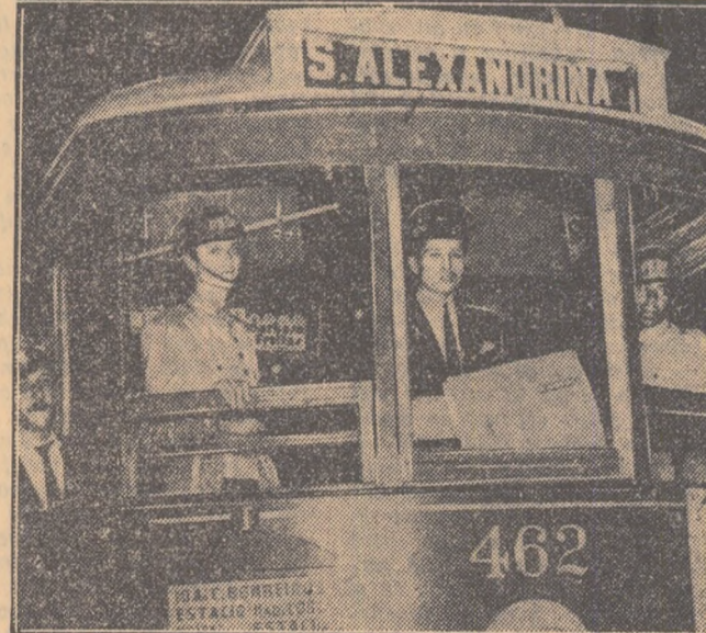
Poliția din Rio de Janeiro a atacat o adunare a muncitorilor din transporturile urbane ce se aflau în grîni, 700 de greviști au fost arestați.

Fotografia noastră înfățișează un tânăr muncitor care e silit să-și rela lucrul sub paza poliției.