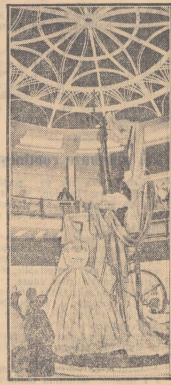
În mijlocul pavilionului, un interesant stand atrage atenția: pe un uriaș manechin este drapată o rochie de seară dintr-un borangic de o rară finețe.

HUNEDOARA (de la corespondentul nostru). Cooperativa meșteșugărească „Solidaritatea” din Deva a luat finință cu clișiva ani în urmă. De la două secții cît avea pe atunci și un număr mic de cooperatori, azi cooperativa are aproape 200 membri care activează în cele 22 secții de cizmărie, croitorie, mecanică, țimplărie etc. Prin munca pe care o desfășoară, meșteșugarii cooperativi reușesc să dea oamenilor muncii din regiune tot mai multe produse de larg consum. Numai la secția Încălțăminte au fost produse cu 300 la sută mai mulți bocanci bărbătești, iar la pantofii bărbătești execuția la comandă s-a realizat în proporție de