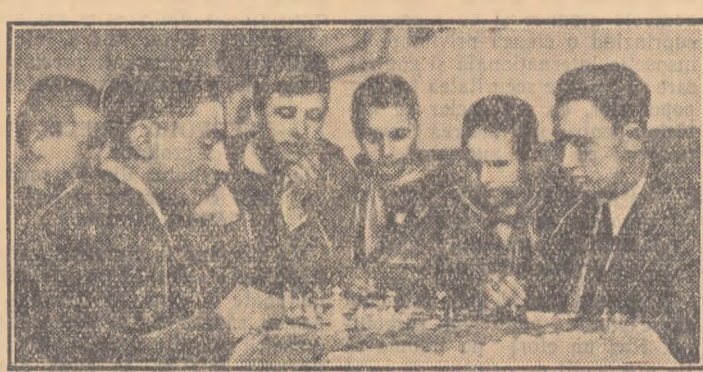
Una din sutele de mii de partide disputate în cadrul Spartachiadei de iarnă a tineretului.