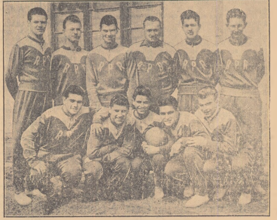
Lotul R.P.R. de juniori care va participa la turneul F.I.F.A. a părăsit ieri Capitala plecând spre Budapesta. Tinerii din patria noastră, urează cu această ocazie speranțelor fotbalului românesc, mult succes.

Am fost în vizită la cel mai tineri internațional al noștri, la fotbalistul lotului R.P.R. de juniori. Componenții echipei se antrenează în vederea întinderii tinerilor speranțe ale fotbalului european: Turneul F.I.F.A., de la Budapesta pentru reprezentativele de juniori.