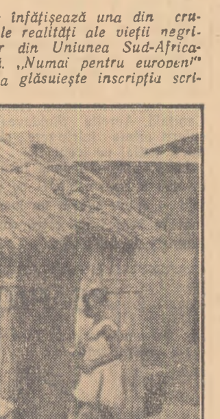
4. În regiunile răsăriteane ale Uniunii Suda-Africane, mulți oameni se ocupă de exploatarea minieră.