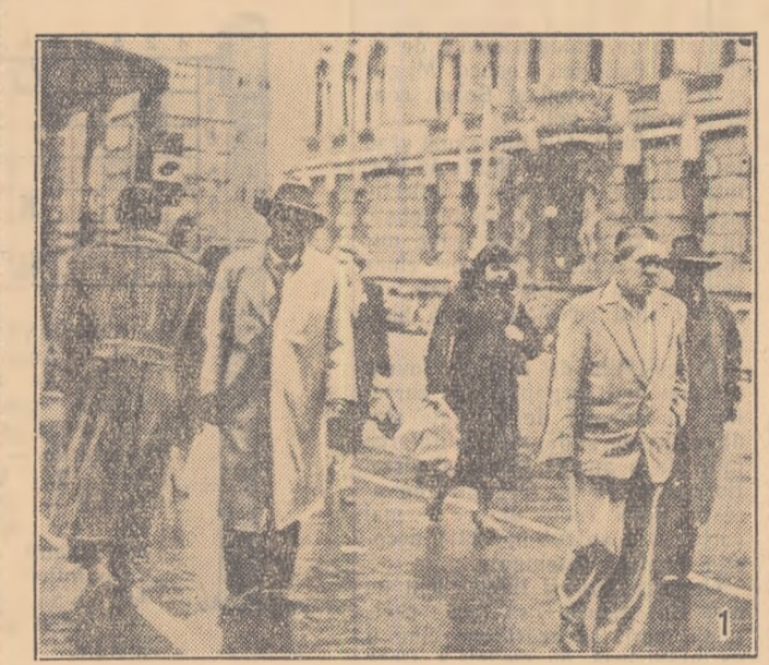
1. Mulți oameni se ocupă de exploatarea minieră în regiunile răsăriteane ale Uniunii Suda-Africane.