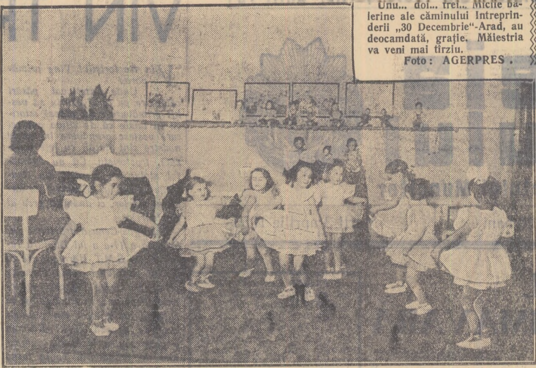
Unu... doi... trei... Micile bănerle ale căminului Intreprinderii „30 Decembrie”-Arad, au deocamdată, grație. Măiestria va veni mai tîrziu.