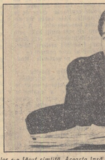
Într-adevăr, lipsa regulamentelor s-a făcut simțită. Aceasta însă nu explică insuficiența popularizării de către Comitetul C.F.S. o-