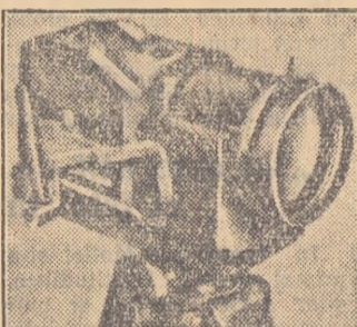
dintre cele câteva lentile care formează obiectivul.

cu distanță focală variabilă, așa numită „lentila de cauciuc”, care permite, de exemplu, menținerea în același cadru a unui obiect mobil ce-și schimbă distanța față de aparat sau obținerea unui efect care să dea impresia că aparatul se apropie sau se depărtează de obiectul de filmat. Operatorul „va alerga” după subiectul filmat prin simpla manevrare a obiectivului. Principiul unui asemenea obiectiv este schimbarea într-un anumit mod a distanțelor