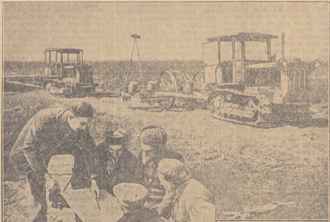
In ralonul Pecloara, regiunea Timșoara, se însămînțează de zor. Fiecare zi, fiecare oră este folosită din plin.

Timpu nu așteaptă; el trebuie folosit din plin. Înainte, pentru victoria deplină în campanie!