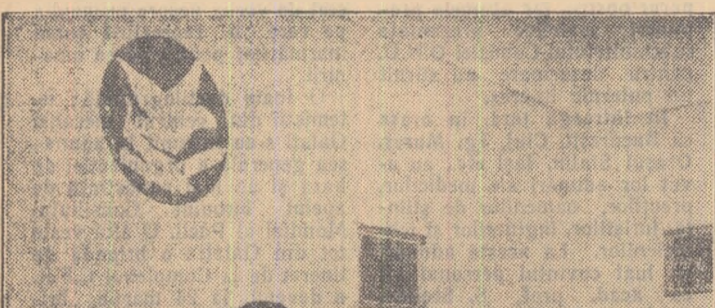
Fotografiile noastre înfățișează aspecte din activitatea a două cluburi.

Bine înzestrat și spațios, noul club muncitoresc „23 August” din Moinești, are o sală de teatru-cinematograf, o bibliotecă bogată, cabine pentru artiști și o sală de lectură.