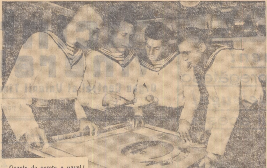
Gazeta de perete a navei este lucrată cu mîgălă de tineri mătzozi. În fotografie se pregătește un număr nou.