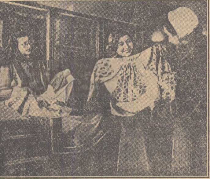
Printre magazinele noi deschise în orașul Constanța este și magazinul de artă populară. Acest magazin este vizitat zilnic de zeci de oameni printre care și mulți străini. El au posibilitatea să cumpere din acest magazin costume naționale din cele mai diferite regiuni ale țării.

Timpul e bun. Tinerii permită lucrări cu tractorul dar în brigada a 11-a precum și în brigada a 8-a domnește lincezeala și nepăsare. Așa sînd lucrurile, s-au pierdut zece ore productive și s-au consumat 600 litri motorină peste plan. S.M.T. Cefa trebuie să lepede de îndată o asemenea productivitate, un asemenea ritm de muncă. Altfel campania de primăvară o să-i aducă doar necazuri și rușine.