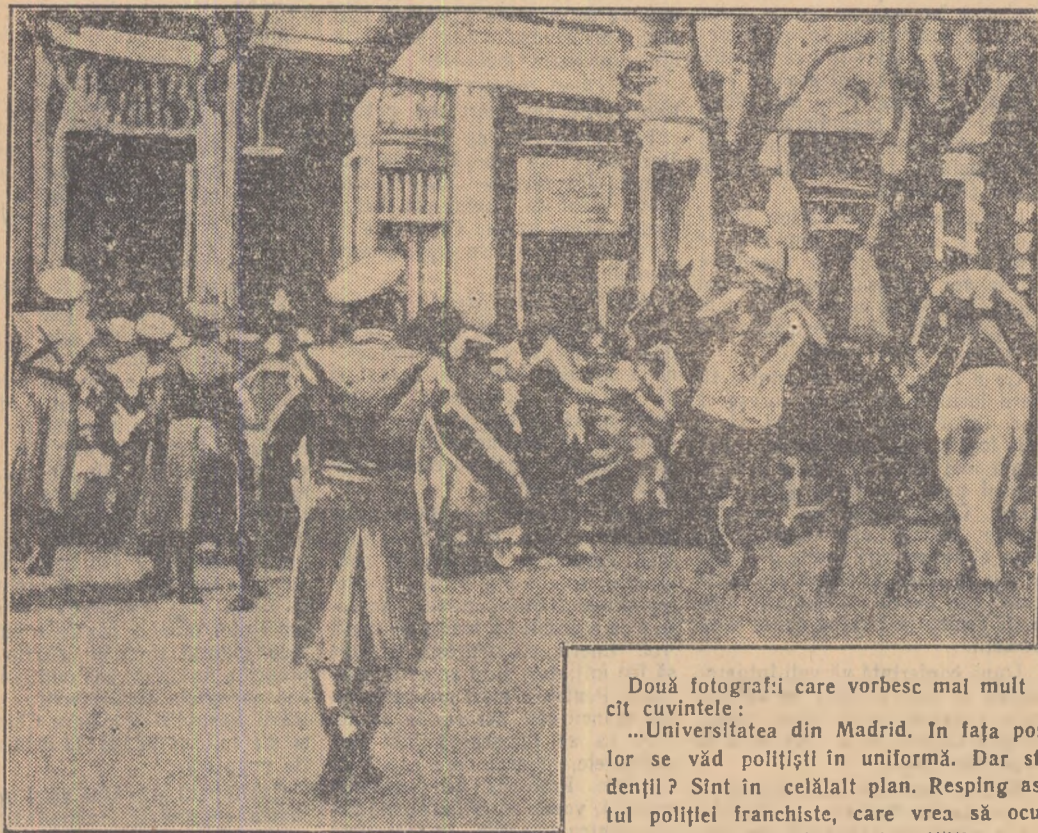
Două fotografii care vorbesc mai mult decât cuvintele: ...Universitatea din Madrid. În fața porții se văd polițiști în uniformă. Dar studenții? Sînt în celălalt plan. Resping asaltul poliției franchiste, care vrea să ocupe auditoriile străvechii universități.

„Da, studenții spanioli, poporul spaniol și-a săturat de dictatura franchistă. Cel 20 ani de dictatură, sint dintre cei mai negri din istoria Spaniei. Poate doar cu anii închișiței se pot compara. Mizerie, intunecime, teroare — iată binefacerea regimului de la Madrid. O tânăra muncitoare spaniolă, pentru 11 ore de muncă pe zi, câștigă într-o săptămână