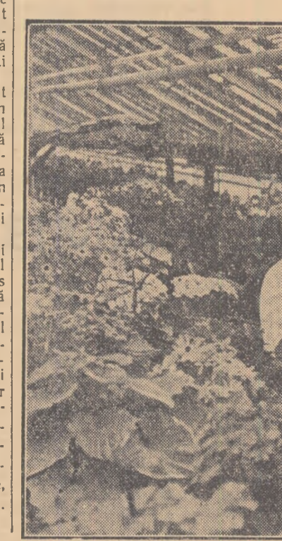
Studenții de la Facultatea de horticultură din cadrul Institutului Agronomic „Nicolae Bălcescu” din Capitală, aplică în practică cele învățate în serele experimentale ale institutului. Produsele sereii sînt vindute întreprinderilor precum și oficilor pentru aprovizionarea populației.