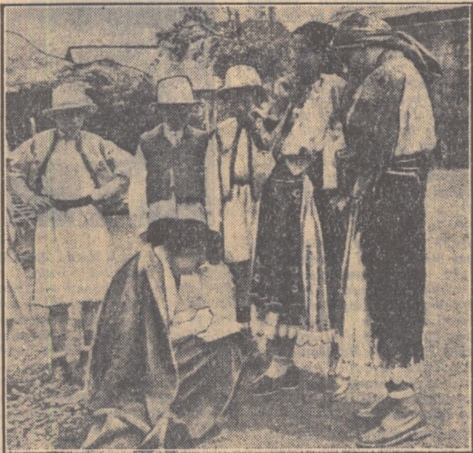
Folcloristul își notează textele cîntecelor

să fie în primul rînd un bun drumet, gata să se descurce în orice împrejurare. În trista care-l însoțește pe cercetător, pe lîngă cele necesare unui drumet se mai găsește de obicei un magnetofon, un aparat de fotografiat, neîmpietate hirtie. Și este cazul să adăugăm ca folcloristul se înarmează și cu o doză serioasă de... răbdare.