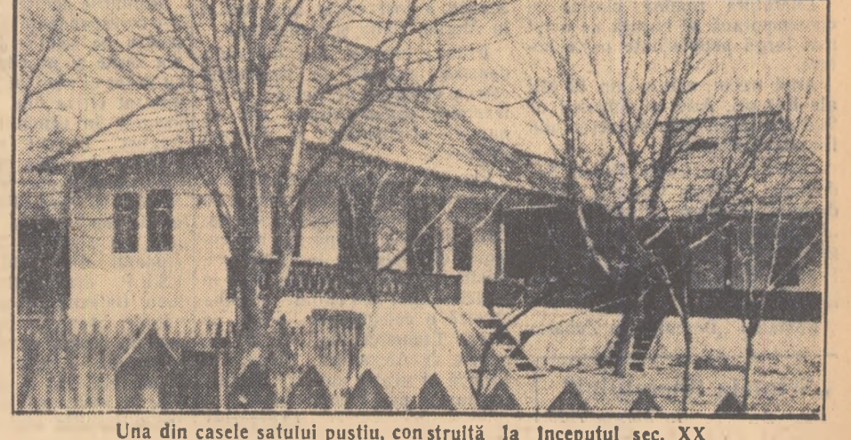
Una din casele satului pustiu, construită la începutul sec. XX

ginea satului mă opresc însă o clipă, apoi pornesc hotărît înapoi. Dacă nu sînt oameni, atunci am să scriu despre casele acestui sat, adică am să fac un reportaj descriptiv. Pornesc deci în documentare. Mă opresc la prima locuință de pe partea dreaptă și o studiez cu atenție. Interesantă. E adîncă cu cele de prin părțile Năsăudului. Curtea nu e prea largă, lângă gard e o cruce străveche și mucegăită, iar casa are două odăi, tîndă și firnă! În spate. Pereții sînt făcuți numai din scînduri groase, de brad, iar acoperșul din șipi. Întru înăuntru și bat la ușă. Un lacăt mare, ruginit și uită chiorșii la mine prin gaura cheii. (Continuare în pag. 2-a)