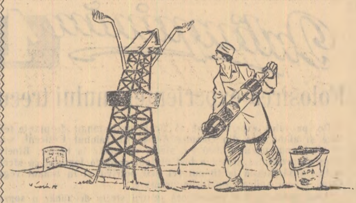
Desen: M. COSTI

Ținînd cont de sarcinile sportive de plan pe 1956 noi vom căuta să extindem aceste metode. De asemenea vom continua stabilirea și precizarea zonelor de influență a injecției, a efectului ei, dirijarea acestuia proces pentru prevenirea erupțiilor negative și în vederea unor efecte pozitive maxime. În afară de acestuia, în prezent la noi se studiază cu atenție posibilitatea de extindere a injecției de apă și la alte straturi. Sintem siguri că aplicînd în mod științific metodele de recuperare secundară vom putea da patriei mai multe tone de fîșei care să contribuie la îndeplinirea și depășirea planului pe anul 1956.