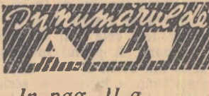
In pag. II-a

A urmat un program artistic prezentat de echipa artistică a fabricii „Flamura roșie”.