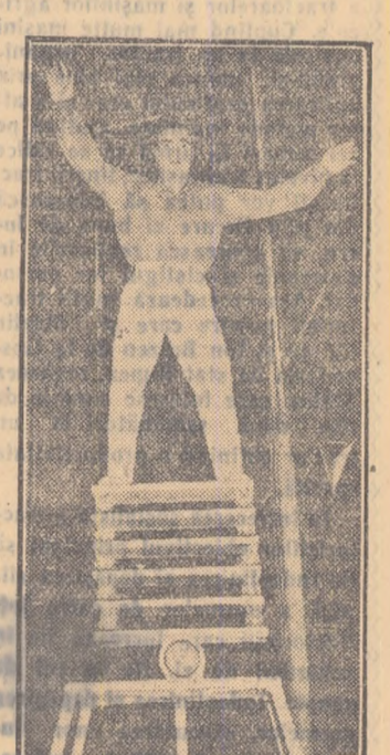
Actorul Boiceanov prezintă numărul său de echilibristică