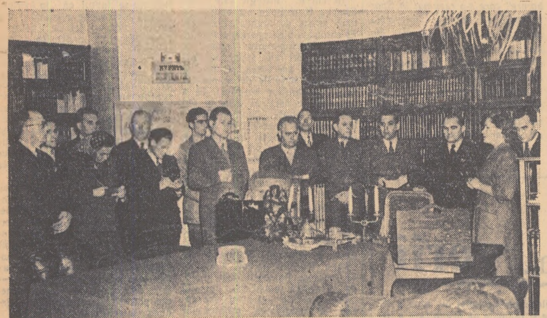
MEMBRII DELEGĂȚIEI MARI ADUNĂRI NAȚIONALE A REPUBLICII POPULARE ROMÂNE ÎN KIEV