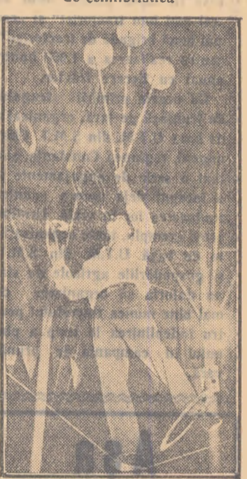
Anghel Bojilov în numărul de acrobație pe sîrmă