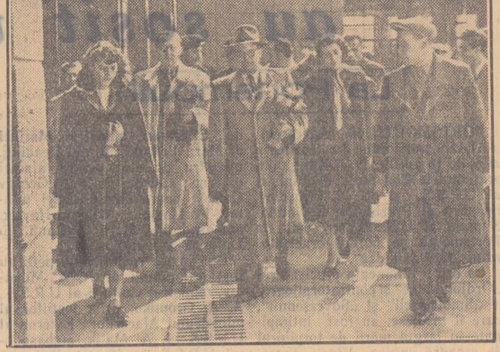
Zilele acestea, un grup de membri ai delegației Comsomolului care se află în țara noastră a vizitat Orașul Stalin. Cu acest prilej, reprezentanții Comsomolului au fost oaspeți ai tinerilor din uzina de tractoare „Ernst Thälmann”. Fotografia de mai sus înfățișează un aspect din timpul vizitei în această uzină.