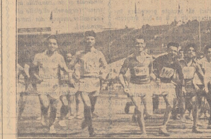
Start! Crosiștii se avîntă cu voloie în cursă mai ales că în mijlocul pistei se pregătește și... fotoreporterul nostru.

Încă de la sfîrșitul lunii februarie noi am început antrenamentele în vederea concursurilor sportive de primăvară. Într-o bună zi, martie, timpul fiind nefavorabil, antrenamentul în aer liber le-am desființat la sală după posibilități. Între timp, în sala am reușit să prestăm în meciul de volei „Știința” (Slănic) — „Flacăra” (Slănic) pe care l-au câștigat elevii cu scorul de 3-1 un joc frumos, apreciat de spectatori. De asemenea 150 de elevi au participat la crosul „Să întîmpinăm 1 Mai”. A fost un concurs viu disputat pentru acei care vroiau să ocure lucrurile 1-5 pentru a se alicifica în faza rațională.