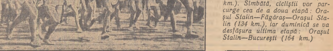
Start! Crosiștii se avîntă cu voloie în cursă mai ales că în mijlocul pistei se pregătește și... fotoreporterul nostru.