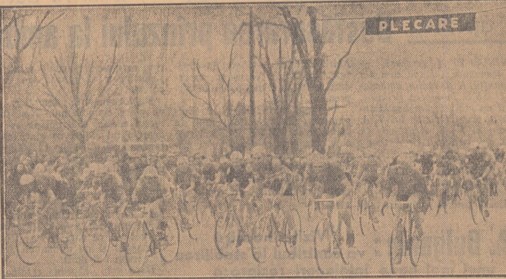
ORAȘUL STALIN (de la trimisul nostru).

leri, la ora 12, din fața Casei Școlare s-a dat plecarea în prima etapă a celei de a 9-a ediții a tradiționalului competiții ciclistice Cursa Școlare.