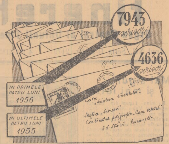
Crește numărul scrisorilor din partea noastră la redacție de la un an la altul. Crește numărul scrisorilor din partea noastră la redacție de la un an la altul...

La începutul acestui an, ziarul a publicat o corespondență intitulată: „Cum a fost găsită o comoră...”