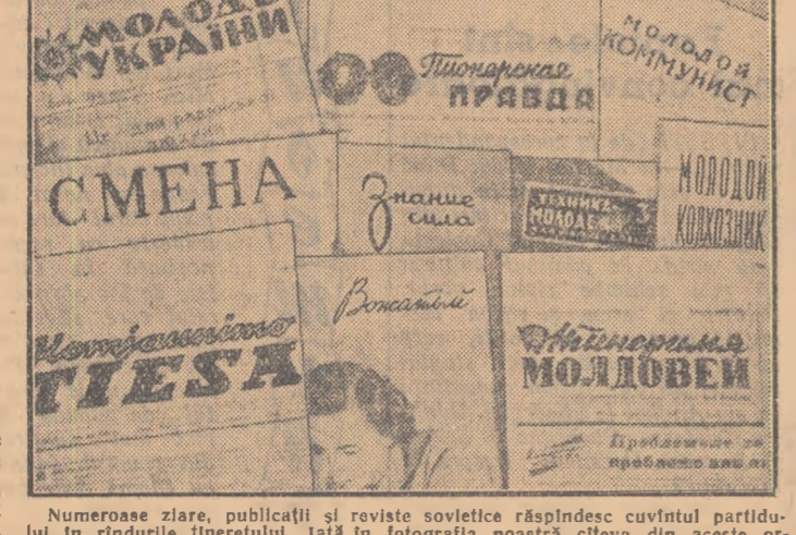
Numeroase ziaruri, publicații și reviste sovietice nașdind cuvântul nostru în zărilor noastre. Iată în fotografia noastră câteva din aceste organe de presă.

„Aceasta nu are nici un rost. Este dăunător să le repeti în mod inutil: aceasta provoacă greșelile, furtivele repetiții...”