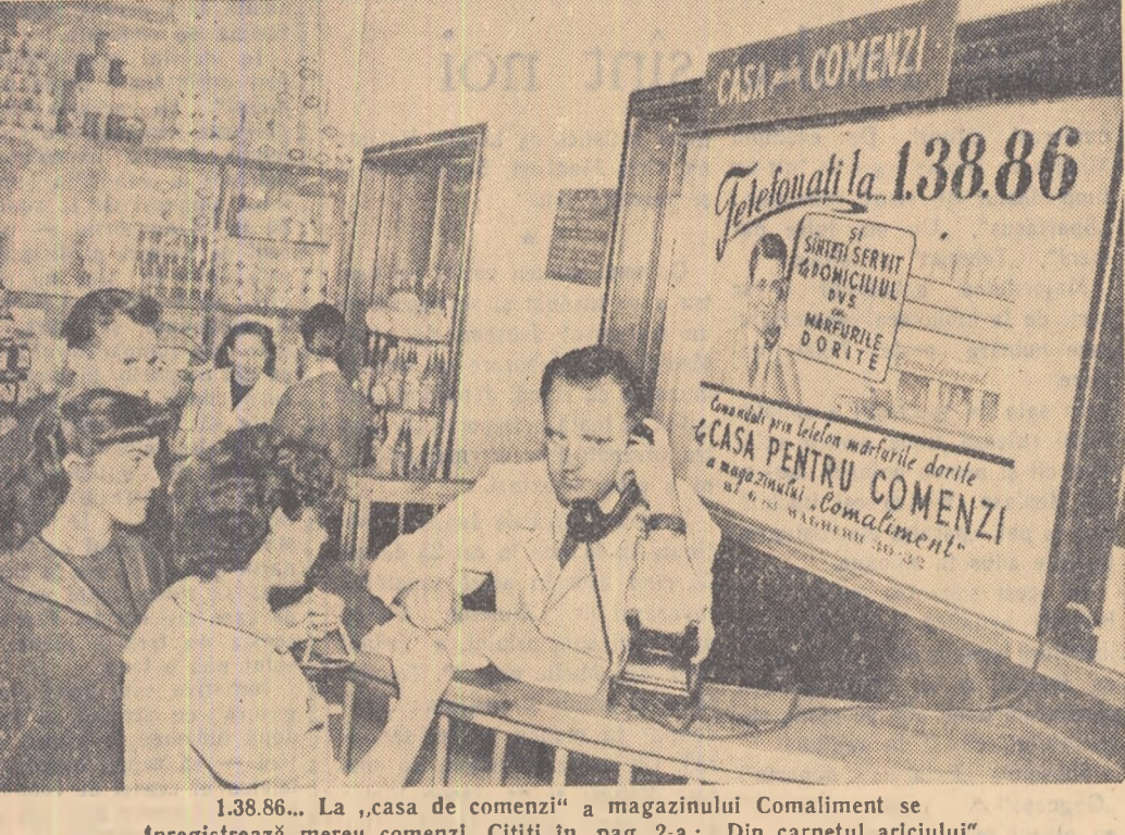
138.86... La „casa de comenzi” a magazinului Comalment se înregistrează mereu comenzi. Citiiți în pag. 2-a: „Din carnetul arciului”.