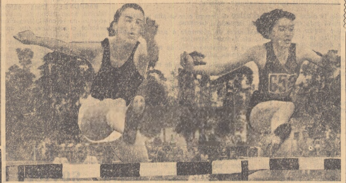
80 m. GARDURI, rămîne o probă spectaculoasă chiar dacă concurențele nu sint altele „consacrate”

În ultima zi a acestei luni, 40 cicliști romîni și bulgari vor porni, de la Sofia spre București, în cadrul celei de a 11-a ediții a „Cursei prieteniei romîno-bulgare”, organizată de ziarul „Informația Bucureștilor” și „Vestiri Novini” (Sofia). Spre deosebire de prima ediție, anul acesta cursa va avea încă o etapă: Giurgiu — București — Ploști — București, unde va fi și sosirea. Cu această etapă, cursa va număra 660 km. Întrecerea cicliștilor Sofia-București se va desfășura astfel: 31 mai: Sofia-Plovdiv. 1 iunie: Plovdiv-Gabrovo. 2 iunie: Gabrovo-Ruse. 3 iunie: Giurgiu-Ploști-București. Ajunși în centrul Ploștiului, cicliștii se vor înapoi la București unde va fi și capătul cursei. După cum sintem informați, clasamentul cursei cicliste Sofia-București, va fi numai individual.