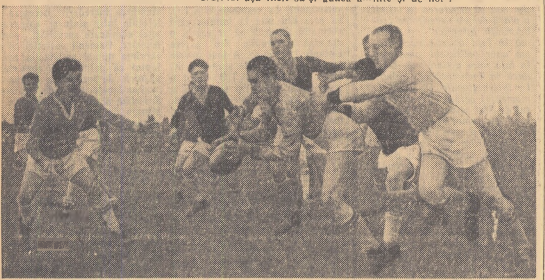
Primul meci al tinerilor laminoriști — tricouri albe — s-a încheiat cu o victorie...

Sintem pe stadionul Locomotiva-Grivița Roșie. Cu câteva clipe în urmă a luat sfârșit un meci de rugbi. Eroii nu sint vedete ale acestui sport. Jucătorii echipei în tricouri roșii par abătuti. Au și de ce. Au pierdut cu 0-35! Ne roagă să-i ajutăm pentru a pune capăt situației neplăcute în care se află: n-au antrenor. După ce fotoreporterul nostru l-a rugat pe jucătorii celor două echipe să execute câteva scheme tactice și ne-am luat rămas bun de la ei, micii rugbiști de la „Vasile Roaită” ne-au strigat din urmă: „Aveți grijă, nu uitați să-i criticați pe tovarășii de la C.C.F.S. așa incit să-și aducă aminte și de noi!”.