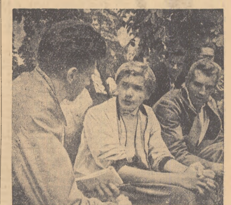
De data aceasta interviul nostru cu Iolanda Balas se desfășoară în „tribună. Alături I. Soeter urmărește atent discuția noastră.

Sîmbătă în cadrul concursului pentru clasificări de pe Stadionul tineretului, maestra sportului Iolanda Balas a realizat o frumoasă performanță pentru stadiul actual de pregătire al atleților noștri. „Ioly” — cum e numită în intimitate — a sărit cu ușurință 1,69 m. Duminică dimineața Iolanda Balas a fost din nou prezentă la Stadionul tineretului, de astădată în tribună, pentru a urmări un concurs. Noi am profitat de acest prilej pentru să-i solicităm un mic interviu în legătură cu stadiul ei actual de pregătire. „Consider că în anul acesta sint mult mai bine