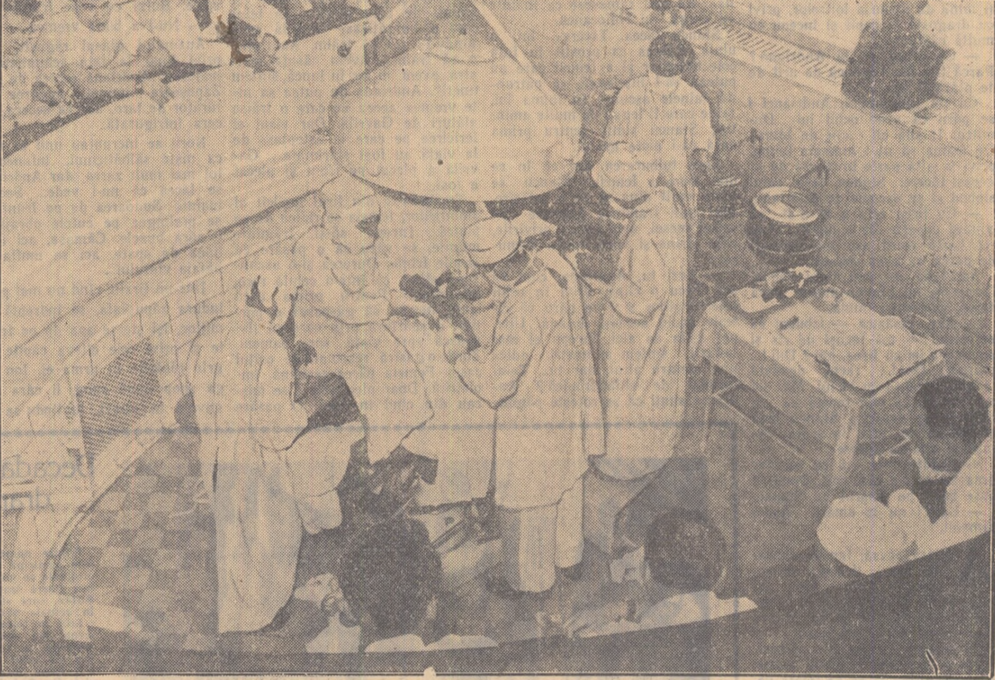
Studenții Institutului medico-farmaceutic din Cluj le s'nt create largi posibilități de a-și exercita cunoștințele cîpătate la cursurile teoretice. Sub îndrumarea medicilor de specialitate et asistați la operații, putînd în felul acesta să-și perfecționeze pregătirea.