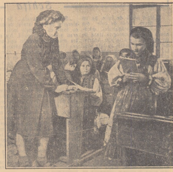
În țara Oașului, — ca în toate colțurile patriei noastre — s-au colțurit școlii noi și luminoase. De pildă, în comuna Certeze, din raionul Oaș, s-a construit nu de mult o școală medie de 10 ani, în care învață cu sîrguință copiii țărănilor muncitori.