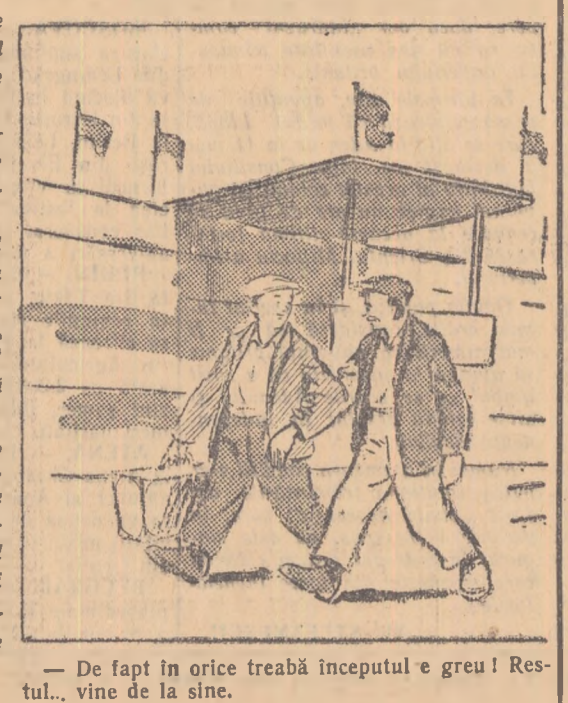
— De fapt în orice treabă începutul e greu! Resursele... vine de la sine.