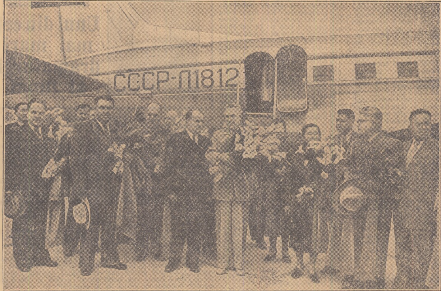
La sosirea oaspeților sovietici

În ovațiile celor prezenți, din avion coboară membrii delegației Sovietului Suprem al U.R.S.S. tovarășii: Frol Romanovici Kozlov, membru al Prezidiului Sovietului Suprem al U.R.S.S., deputat în Sovietul Uniunii, prim secretar al Comitetului regional Leningrad al P.C.U.S., conducător delegației; Vera Rintinovna Bolanova, membru în Prezidiul Sovietului Suprem al U.R.S.S., deputată în Sovietul Naționalităților, ministrul Sănătății al R.A.S.S. Buriat-Mongole; Isa Konoevici Ahunbaev, deputat în Sovietul Naționalităților, președintele Academiei de Științe a R.S.S. Kirghize; Aleksandr Filippovici Diordăia, membru al Comisiei bugetare a Sovietului Naționalităților, vicepreședinte al Consiliului de Miniștri al R.S.S. Moldovenești; Mihail Safranovici Siniță, deputat în Sovietul Uniunii, prim secretar al Comitetului orășenesc Kiev al P.C. al Ucrainei; Tatjana Ivanovna Antropova, membru al Comisiei bugetare a Sovietului Uniunii, directoroarea Școlii medii nr. 6 din Vișni Voeckol, regiunea Kalinin; Ionas Ionovici Vilidjunas, deputat în Sovietul Naționalităților, președintele Comitetului executiv al Sovietului Orășenesc din Vilnius; Vasili Ivanovici Golovenko, deputat în Sovietul Uniunii, mecanic șef la S.M.T.