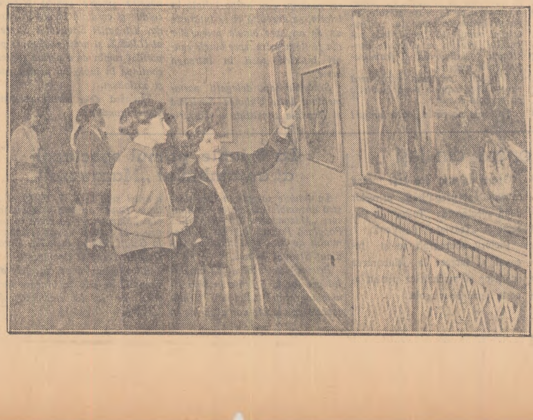
Expoziția de artă plastică contemporană iugoslavă