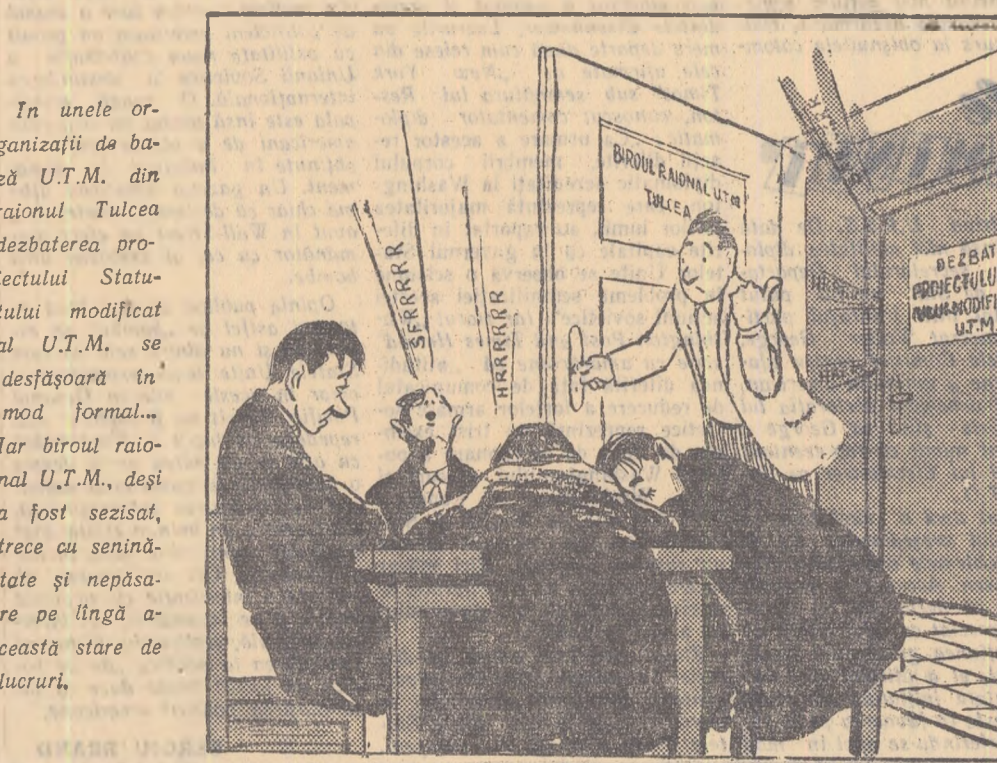
— Ce faceți, tovarășii? I Sforșii mai încet că-i molipsiți și pe ăia de dincol!

— Ce să faci, tovarășii? I Sforșii mai încet că-i molipsiți și pe ăia de dincol!