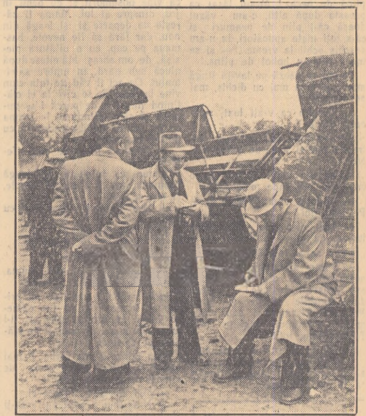
Un popas la G.A.S. Fundulea. Oaspeții sovietici își notează impresiile.