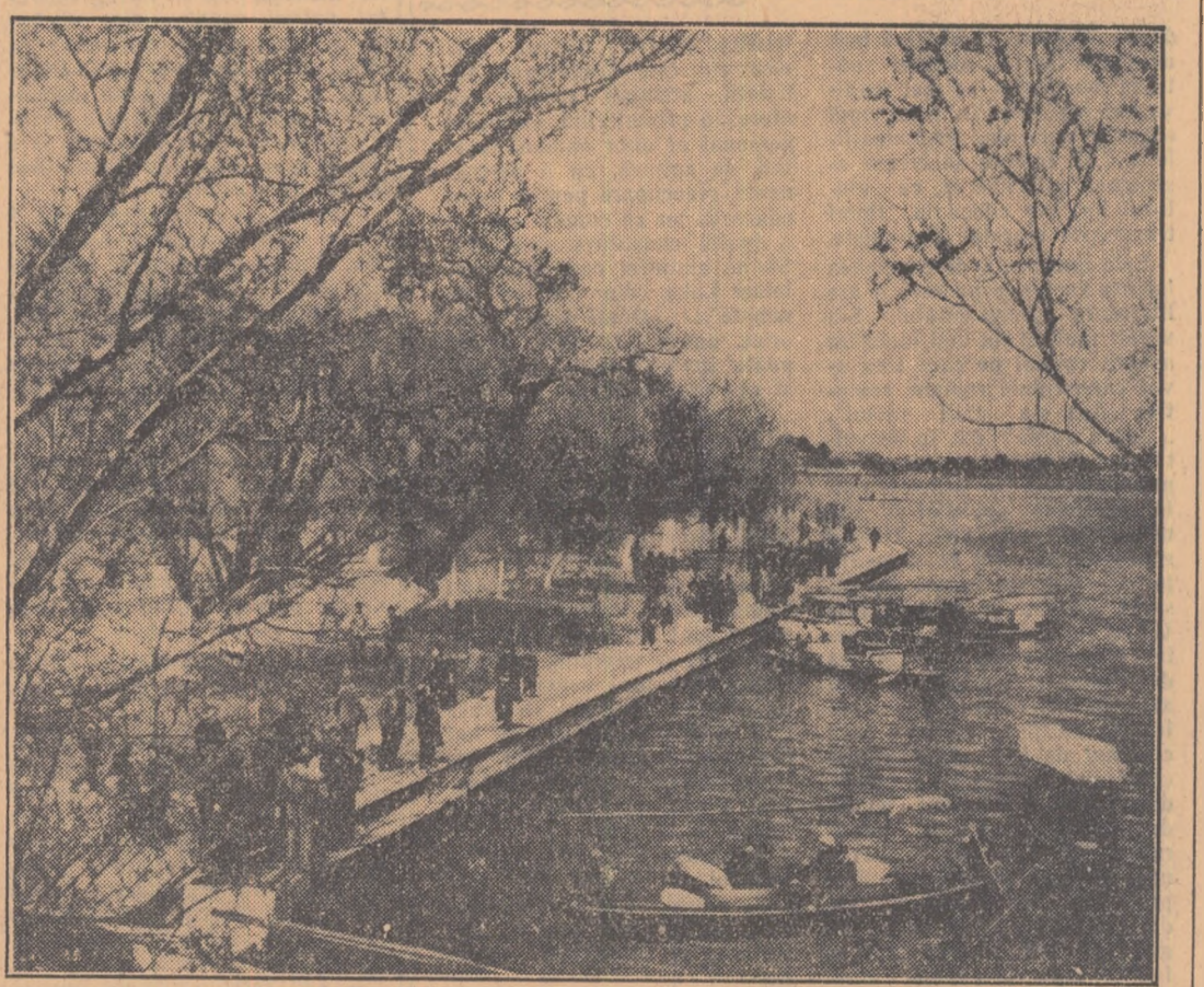
Oamenii lucru ale R.P. Chineze au organizat numeroase excursii în cel mai pitoresc locuri din țării. În fotografie: turiști, pe malul lacului de Vest.