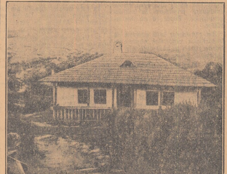
Bojdeuca lui Ion Creangă, în care el a scris multe din cele mai cunoscute povestiri românești.

Cerdacul bojdeucii lui Creangă a fost o veritabilă casă de creație literară.