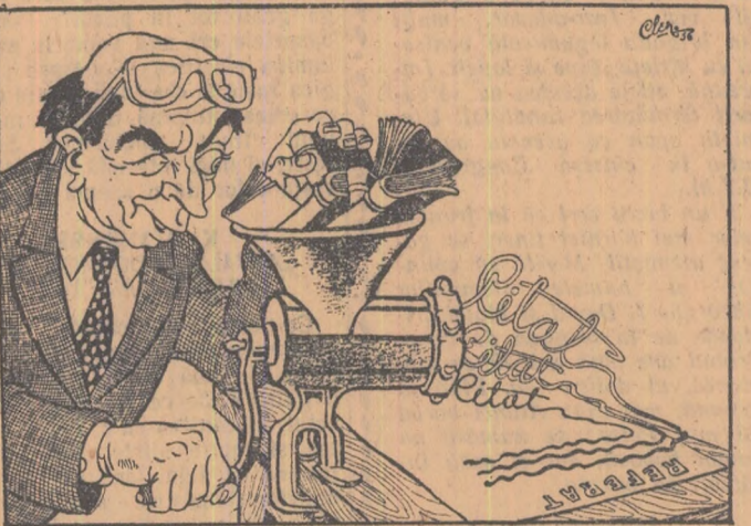
...Intocmindu-și referatul (Desen de CLENCIU)