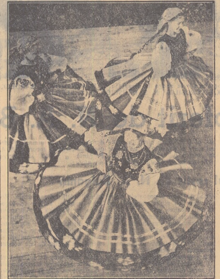
Un dans al ansamblului polonez

Azi își începe turneul în țara noastră cunoscutul ansamblu polonez de cîntec și dansuri populare Mazowsze, cu care vă vom face cunoscuți în rândurile care urmează: