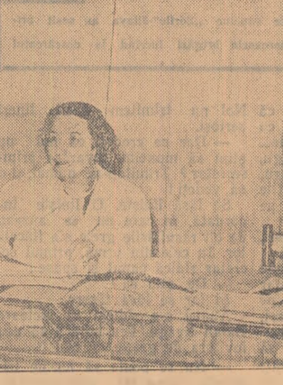
Lucrările noastre sînt cunoscute peste hotare

— Care sînt concluziile savanților în acest domeniu? — După cele arătate, privind scăderea mortalității, faptul că internajii din cîmînu Institutului nu mai sînt invaziți, că el lucrează și sînt domniile de viață și de acțiune, ca și cercetările experimentale pe care le continuăm, ne îndreptătesc să susținem că viața poate fi prelungită.