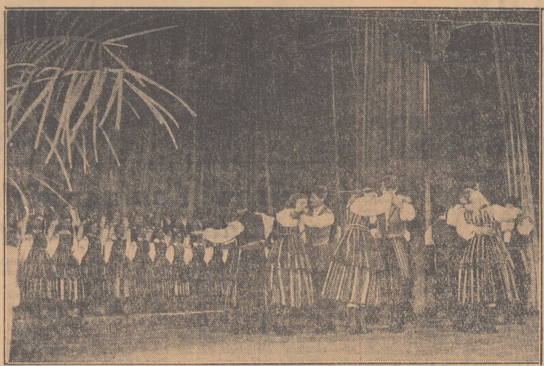
Aspect de la primul spectacol prezentat de ansamblul popular de stat de cîntec și dansuri „Mazowsze” din R. P. Polonă

Introducerea micilor mecanizări depinde în mare măsură de inițiativa creatoare a muncitorilor și tehnicienilor și este în interesul personal al acestora deoarece prin introducerea micilor mecanizări munca se ușurează și productivitatea muncii crește (iar odată cu ea crește și câștigurile muncitorilor). Organizațiile U.T.M. trebuie să studieze în mod concret toate posibilitățile de a introduce și a aplica mecanizări și să stimuleze inițiativa tinerilor în folosirea și dezvoltarea ei.