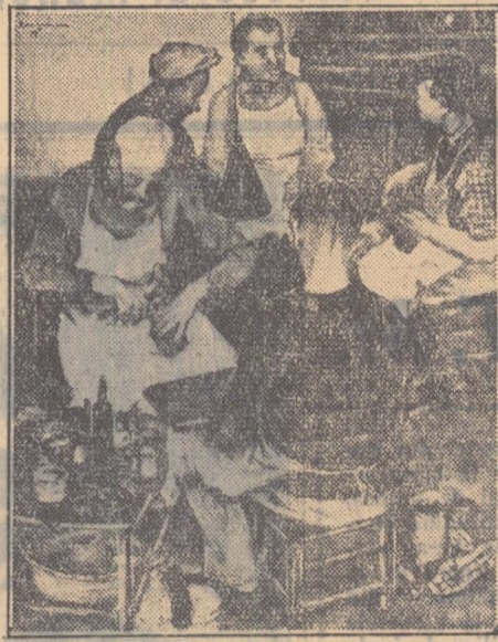
Reproducem aci două dintre lucrările tinerilor artiști expuse la expoziția de grafică.

Un alt aspect îmbucurător al actualii expoziții de grafică este și acela că lucrările expuse înmănușiază