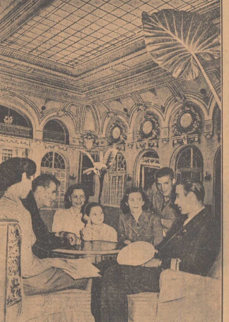
Într-o sală a Palatului Cultural din Sîntina