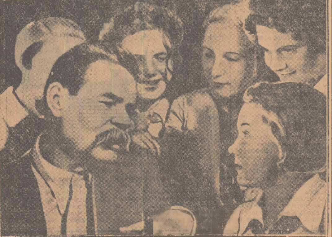
Maxim Gorki în mijlocul unui grup de tineri sovietici

Cum spunem, Dan și-a pierdut busola și ridicolul situației sale constă în aceea că toate planurile, toate acțiunile lui, deși par atît de încheiate în un moment dat, sînt cît se poate de subrede, fiind clădite pe nisipul lăzilor unei reflecțiuni a ordinii capitaliste. Ridicolul situației lui Dan constă în aceea că el nu face demagogie, nu umblă numai să-i sperie pe țărîni muncitori, ci crede sincer că va veni vremea să „încalece pe bălană, să-i dea pînteni și să scere cu mitraliera”. Dan e antiistoric nu fiindcă încearcă să-i împileze