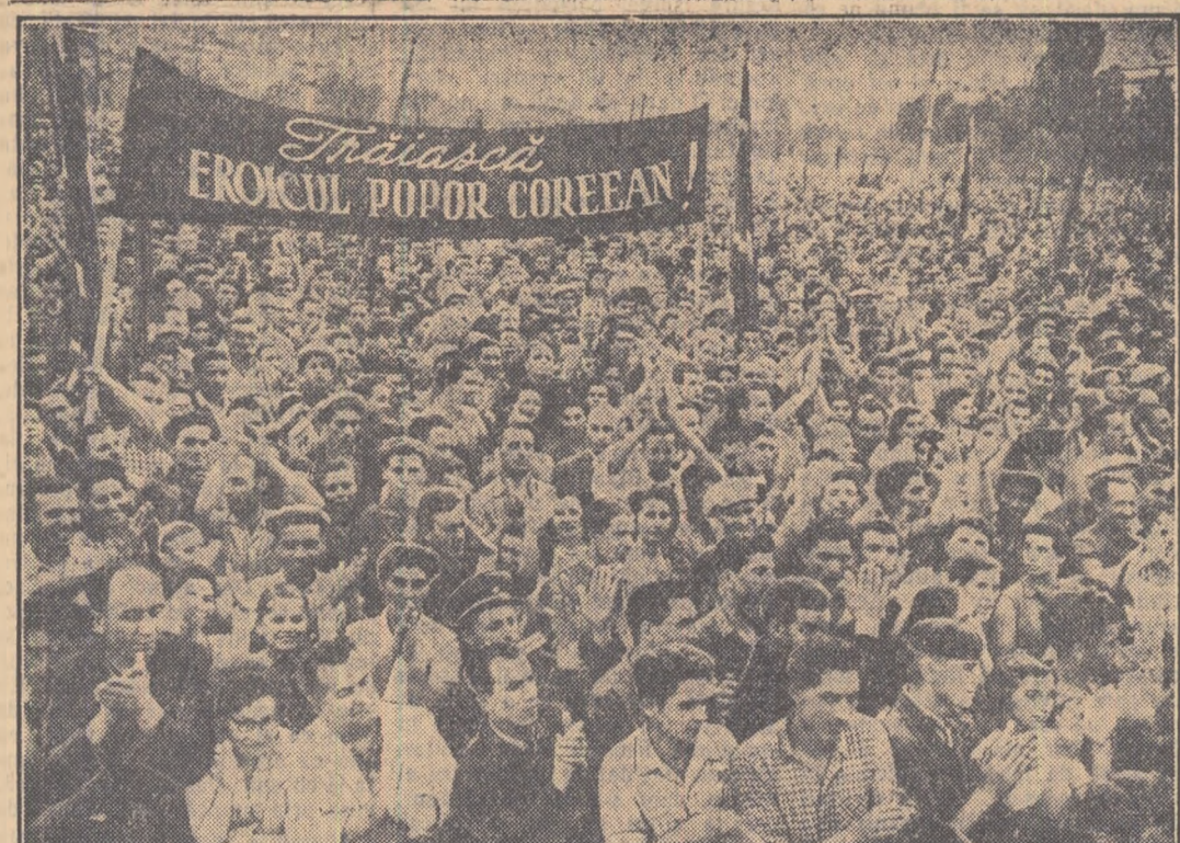
Oamenii muncii din Capitală au salutat cu căldură pe oaspeții Coreeni. În fotografie: Un aspect de la meetingul din piața Victoriei.