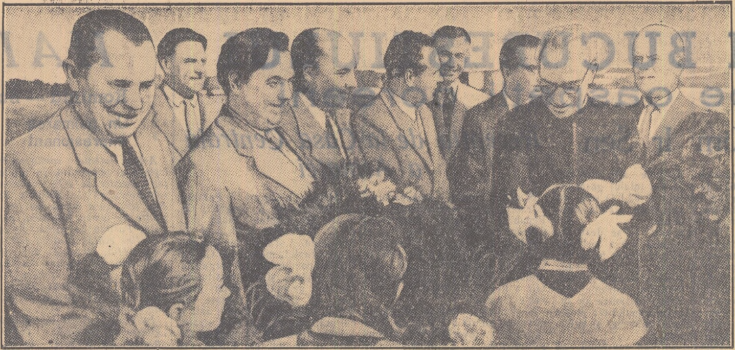
Sosirea la Moscova a vicepreședintelui Republicii India, S. Radhakrishnan. În fotografie: întâlnirea de pe aeroportul central.

Experiența dv. și a noastră, a continuat dl. Radhakrishnan, arată că noi trebuie să luptăm împotriva colonialismului sub orice manifestare.